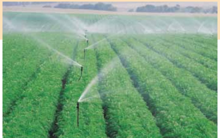
Mamkad 16 Tabla de Rendimiento - Boquillas de trayectoria elevada

Miniaspersor impulsado a bolilla de bajo volumen Rosca macho de 1/2" montado sobre el Irristand 5l o en elevador