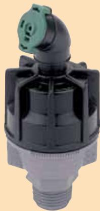
Regulado (base platada)