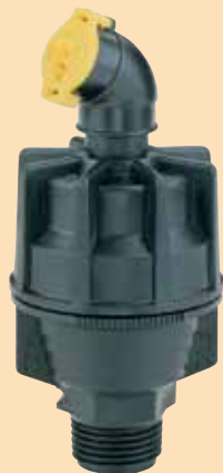
No regulado (base negra)