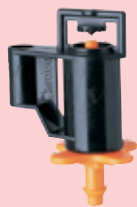
espiga 4 mm